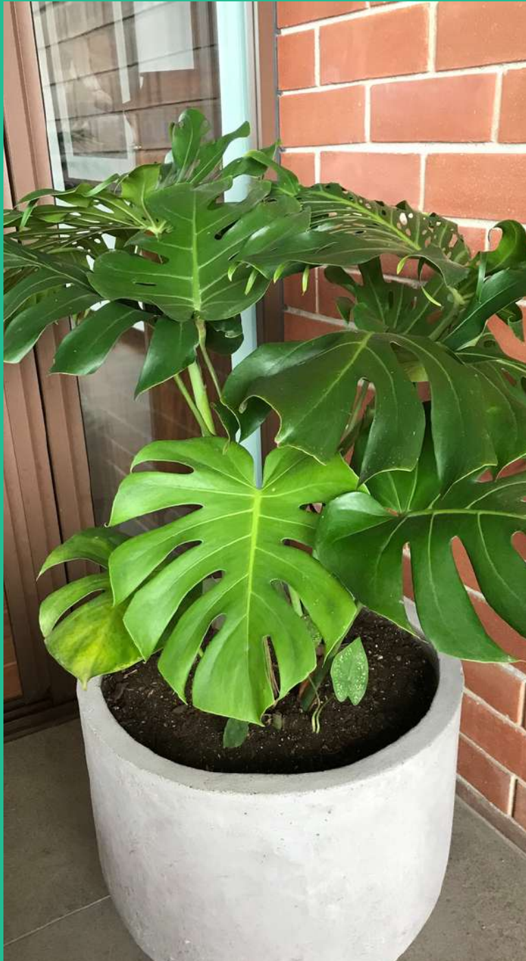
Mano de León